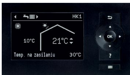
Wyświetlacz regulatora pompy ciepła Vitotronic 200